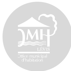
Office municipal d'habitation de Lévis