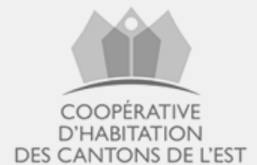
Coopérative d'habitation des Cantons de l'Est