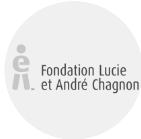
Fondation André et Lucie Chagnon