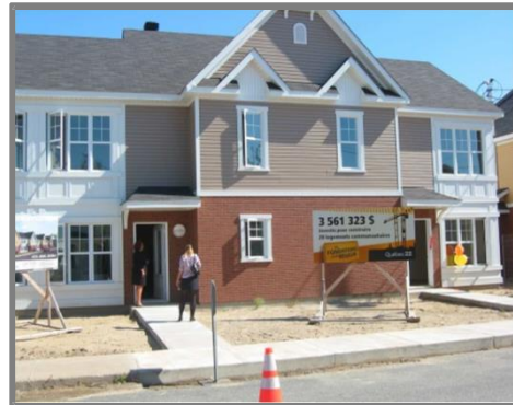
Les Habitations Saint-Maxime, Sorel-Tracy Habitation pour les familles ayant au moins trois enfants. 20 logements

Depuis sa mise sur pied, le programme AccèsLogis et, dans une moindre mesure, le programme Logement abordable Québec, ont permis de soutenir le financement de quelque 35 000* unités d'habitation , essentiellement en coopérative ou en organisme sans but lucratif d'habitation, partout au Québec . Ces habitations permettent à des dizaines de milliers de ménages à modeste ou faible revenu d'accéder à un habitat de qualité et d'avoir la possibilité de demeurer dans leur communauté d'appartenance.