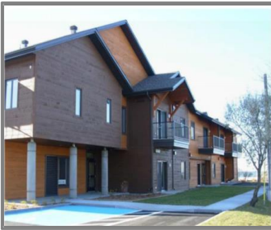
Villa Vents et Marées, Ste-Flavie Projet pour aînés. 20 logements

Les immeubles communautaires développés avec AccèsLogis depuis 1997 font état de cette diversité. Au-delà de réalités locales très différentes, l'implication collective et l'effort financier des communautés pour développer des logements coopératifs et à but non lucratif avec AccèsLogis dénotent un trait commun : la volonté et la capacité des communautés à prendre en main la réponse à leurs problèmes de logement.