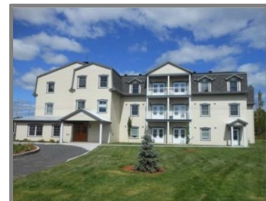
Maison St-Antoine-de-Tilly, Chaudière-Appalache Projet pour les personnes âgées de 75 ans et plus. 19 logements

L'habitation communautaire permet d'offrir des logements familiaux locatifs à un coût abordable dans un environnement qui correspond aux besoins et à la réalité des familles. Depuis 1997 , les GRT membres de l'AGRTQ ont réalisé plus de 10 900** logements destinés principalement aux familles avec le programme AccèsLogis . Ces logements sont répartis dans 361 immeubles érigés dans 77 municipalités . Rappelons que le secteur privé de la construction résidentielle ne produit que très peu de logements locatifs et que les nouveaux logements offerts en copropriété sont généralement destinés à des ménages sans enfants.