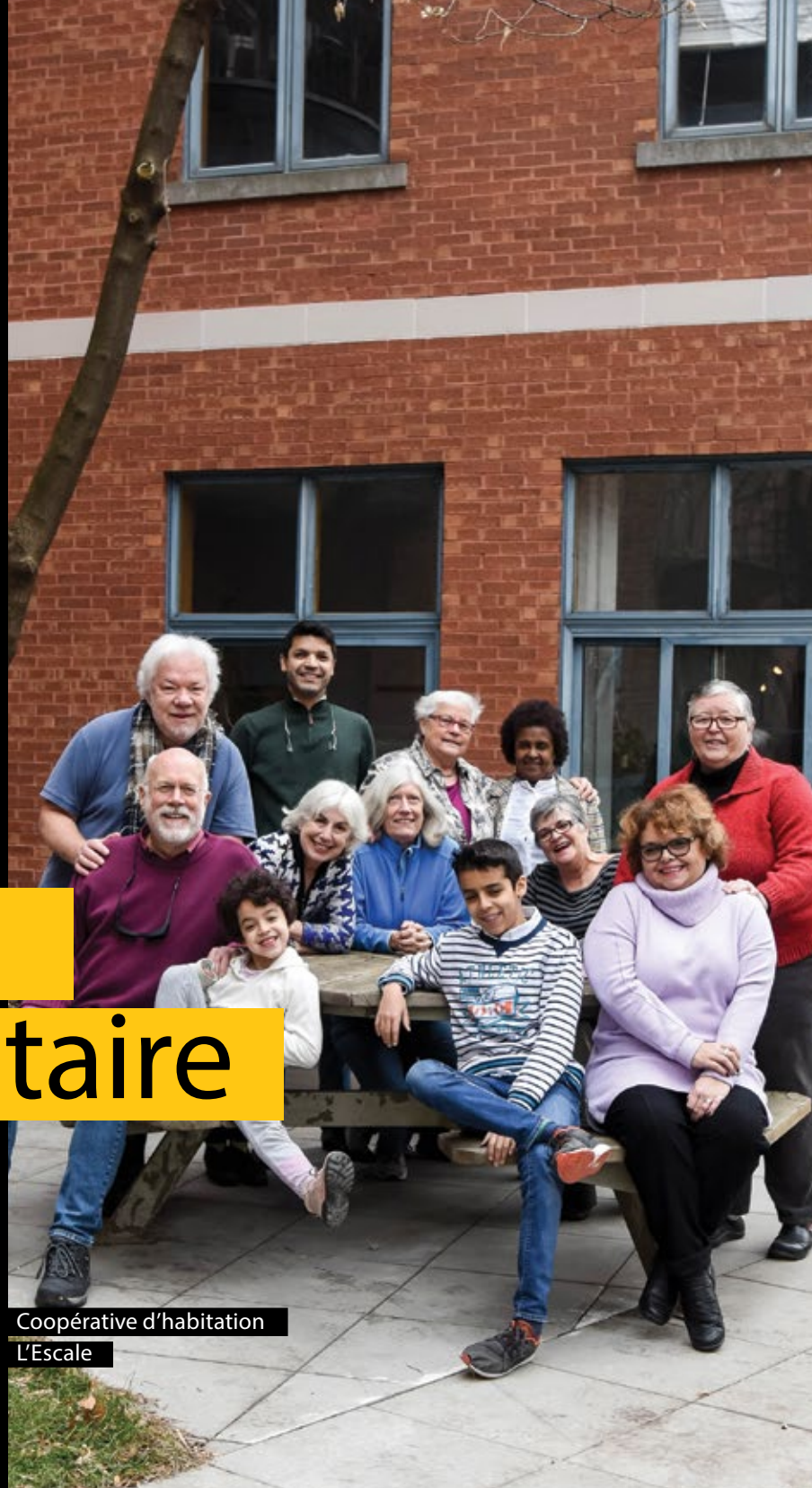
Coopérative d'habitation L'Escale